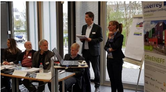
Diane Dupont beantwortete Fragen der Workshopteilnehmerinnen und –teilnehmer/ Diane Dupont a répondu aux questions des participants de l'atelier

Für Luxemburg erläuterte Diane Dupont, erste Regierungsrätin im luxemburgischen Wohnungsbauministerium und Vorsitzende des Verwaltungsrats des Fonds du Logement über die Strukturen für die Schaffung günstigen Wohnraums in Luxemburg. Oberstes Ziel ist es, preisgünstige Eigentumswohnungen anzubieten, um es weniger wohlhabenden Luxemburgern zu ermöglichen, trotz der äußerst hohen Immobilienpreise Eigentum im eigenen Land zu erwerben.