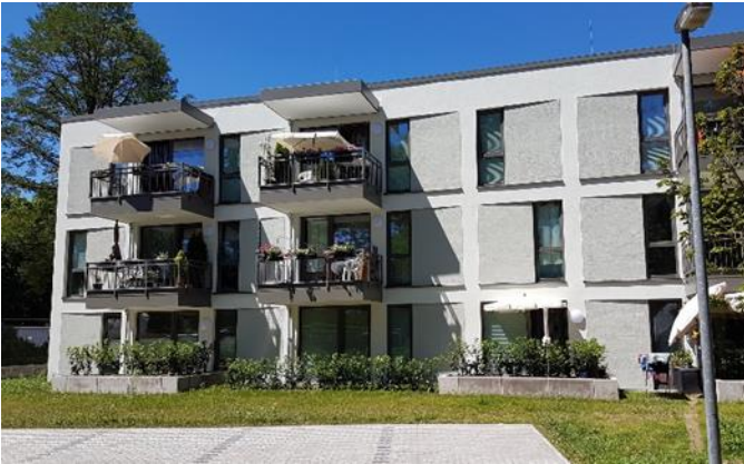
Energieeffizienter und nachhaltiger sozialer Wohnungsbau der GBS im Husarenweg 12 in Saarlouis/ Construction de logement social durable et énergétiquement efficient de la GBS au Husarenweg 12 à Saarlouis; Foto/ Photo: ARGE SOLAR

SOLAR, Olaf Gruppe, le responsable du projet GReNEFF et des représentants des services publics municipaux de Saarlouis à propos de l'état d'avancement des systèmes intelligents devant permettre d'optimiser l'utilisation de l'énergie dans les bâtiments.