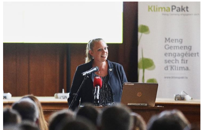
Carole Dieschbourg, Ministerin für Umwelt, Klima und nachhaltige Entwicklung/ Ministère de l'Environnement, du Climat et du Développement durable

L'énergie solaire joue un rôle central dans la réalisation des objectifs climatiques au niveau national. De récentes mesures gouvernementales (comme l'instauration de meilleurs tarifs d'injection pour l'énergie photovoltaïque) visent à promouvoir la construction de nouvelles installations photovoltaïques. Deux mesures concrètes doivent lancer de nouvelles activités : le concours « solar challenge » et un renforcement du soutien à la mise en œuvre des coopératives énergétiques dans les communes.