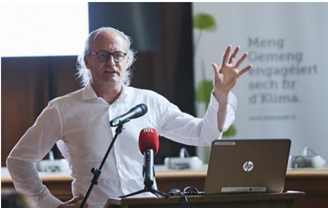
Claude Turmes – Minister für Energie und Raumentwicklung/ Ministre de l'Énergie et de de l'Aménagement du territoire

Um den ehrgeizigen Klimazielen gerecht zu werden, wird sich auch der Klimapakt in der nächsten Phase von 2021 bis 2030 gezielt weiterentwickeln. Drei Bereiche rücken verstärkt in den Fokus. Zum einen sollen neben qualitativen Maßnahmen auch quantitative Indikatoren verstärkt verfolgt werden. Des Weiteren sind die Stärkung des Arbeitsrahmens der Gemeinden sowie das Anstreben von mehr Bürgerbeteiligung zentrale Ziele.