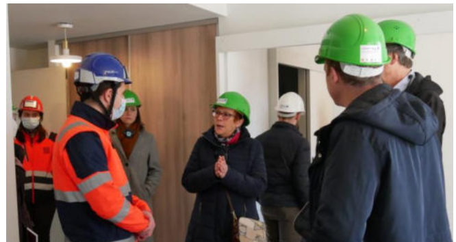
Visite d'un appartement modèle pour seniors avec des échanges animés entre les participants. En vedette : Elisabeth HAAG, vice-présidente du département de la Moselle & conseillère départementale du canton de Stiring-Wendel.

L'emplacement est stratégique car à proximité de nombreux services (crèche, écoles, banque, pharmacie, médecin ..), tandis que le projet prévoit l'aménagement extérieur d'un espace partagé pour les résidences, ainsi qu'un espace intergénérationnel vertical de 3 niveaux, et d'installations sportives à proximité. L'ensemble des logements sera accessible aux personnes à mobilité réduite, tandis que l'accès à l'espace public sera accessible à tous les occupants.