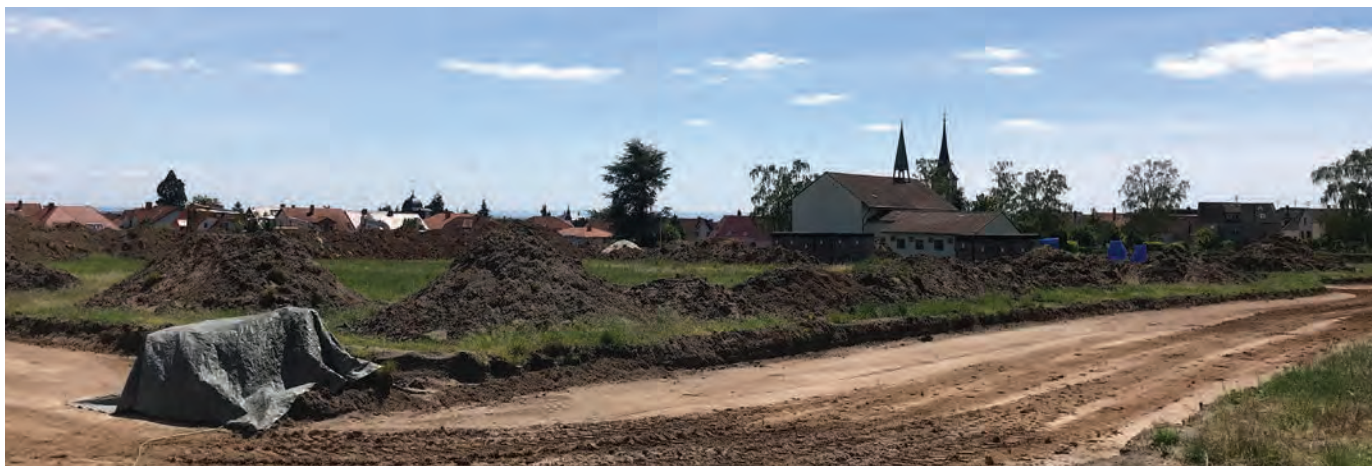
Vue du chantier de construction Avril 2020