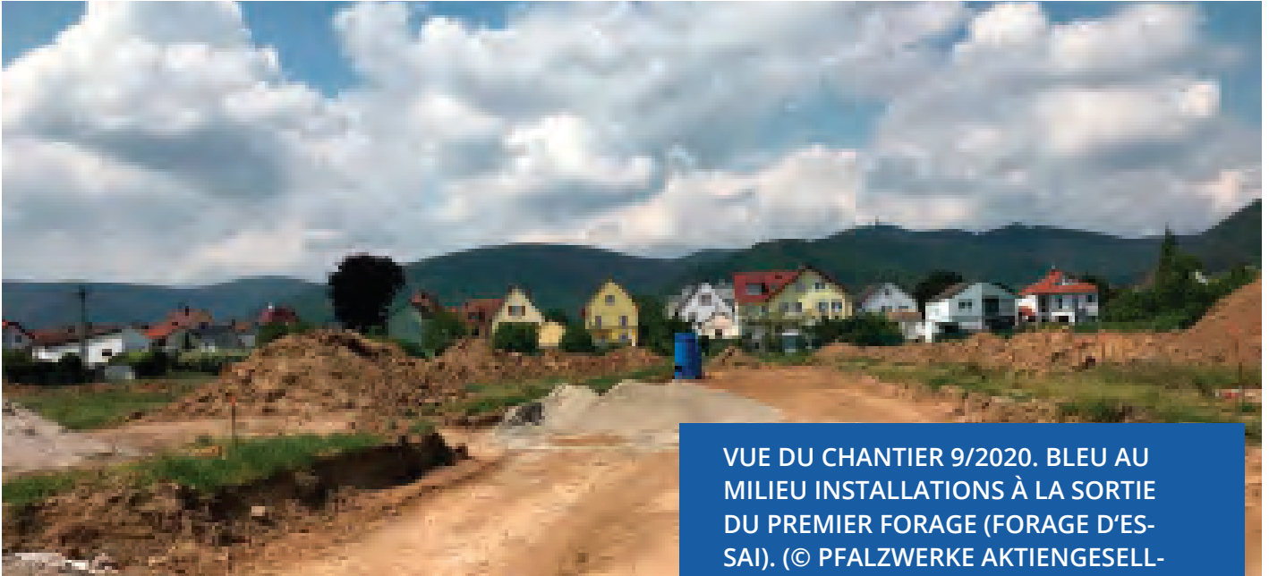
VUE DU CHANTIER 9/2020. BLEU AU MILIEU INSTALLATIONS À LA SORTIE DU PREMIER FORAGE (FORAGE D'ES-SAI).