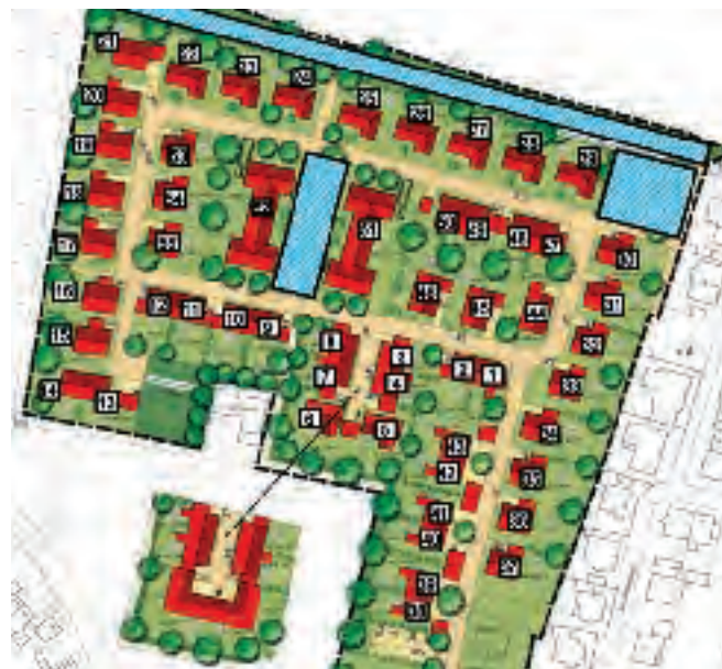
Plan de la nouvelle zone de développement avec les zones potentielles pour les sondes géothermiques.

privées seront équipées de leur propre système de contrôle intelligent auquel les résidents pourront accéder de n'importe où. En outre, une application est prévue pour un meilleur échange dans le quartier. Par exemple, il est possible de coordonner des covoiturages ou d'annoncer des événements. Pour préserver les ressources, l'eau de pluie est collectée et utilisée pour la chasse d'eau des toilettes et comme eau de jardin. Un réseau attrayant de sentiers pédestres favorisera la marche. Un aménagement de niveau des rues est adapté aux personnes à mobilité réduite. En outre, un réseau cyclable sera créé avec des connexions au réseau régional ou national de pistes cyclables, par exemple le „Kraut-und-Rüben-Radweg“. Pour promouvoir l'e-mobilité, une station de recharge accessible au public sera installée à environ un kilomètre du quartier. En fonction de leurs souhaits, les propriétaires privés peuvent s'associer pour fixer une installation de recharge commune à leur maison. Pendant les travaux de construction, on veille à ce que le site soit durable : Pflazwerke respecte les dispositions légales en matière de stockage, de tri et de recyclage. Dans la mesure du possible, les déchets de matériaux de construction sont recyclés ou des matériaux déjà recyclés sont utilisés pour remplacer les matières premières. Les biens protégés définis par la loi, tels que la nature, les espèces existantes ou le sol, sont conservés et les ouvriers du bâtiment sont formés en conséquence.