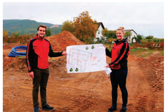
Inspection du site en octobre 2021