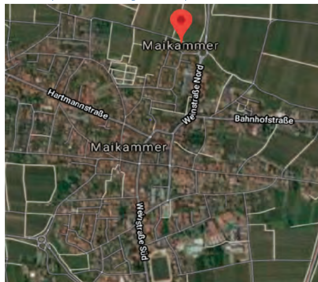
La nouvelle zone de développement dans le village