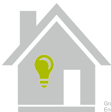
Grafik / graphique : Energieagentur Rheinland-Pfalz

Darüber hinaus wurde das geplante Output der sozialwissenschaftlichen Begleitforschung konkretisiert. Es sollen Merkmale für Good-Practice-Beispiele im Bereich „Maßnahmen zur Steigerung verhaltensbezogener Energieeffizienz“ formuliert werden. Diese sollen später auch als Basis für die Erstellung eines Veranstaltungs-Programms dienen. Darüber hinaus sollen auch Handlungsempfehlungen mit Handreichungen formuliert werden. Diese Empfehlungen richten sich nicht nur an die GReNEFF-Projektträger, sondern auch an Projektträger anderer Projekte. Die Handreichungen bestehen zum Beispiel aus Fragebögen und Interviewleitfäden für die Befragung der Nutzer*innen als Tools für Projektträger und aus formulierten Kriterien zum Thema „verhaltensbezogene Energieeffizienz“ für den Kriterienkatalog.