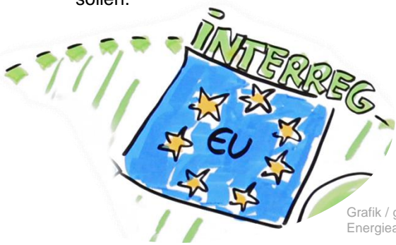
Grafik / graphique : Energieagentur Rheinland-Pfalz

Im darauffolgenden Vortrag beschrieb Eva Hauser (IZES gGmbH), wie im Zuge des im November 2020 gestarteten Projekts PV follows function innovative Formen der AgriPV und der gebäudeintegrierten PV (BIPV) in der Großregion bekannter gemacht werden sollen.