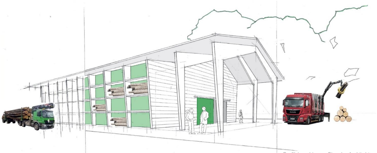
Grafik/graphique : Sieveke Architekten BDA