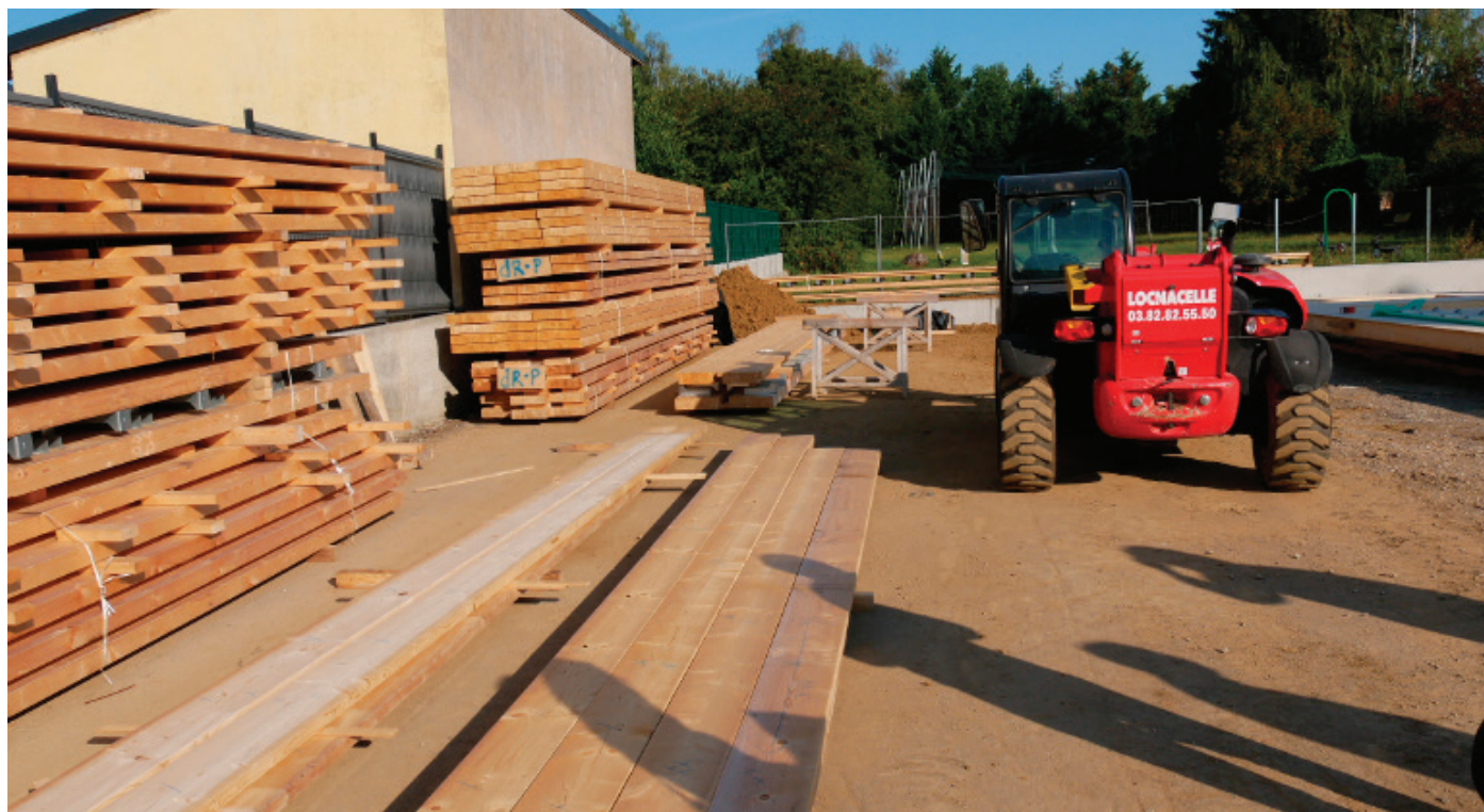
Le chantier de construction en septembre 2020. Les éléments en bois sont assemblés sur place. L'atelier du charpentier est situé sur le site de construction.