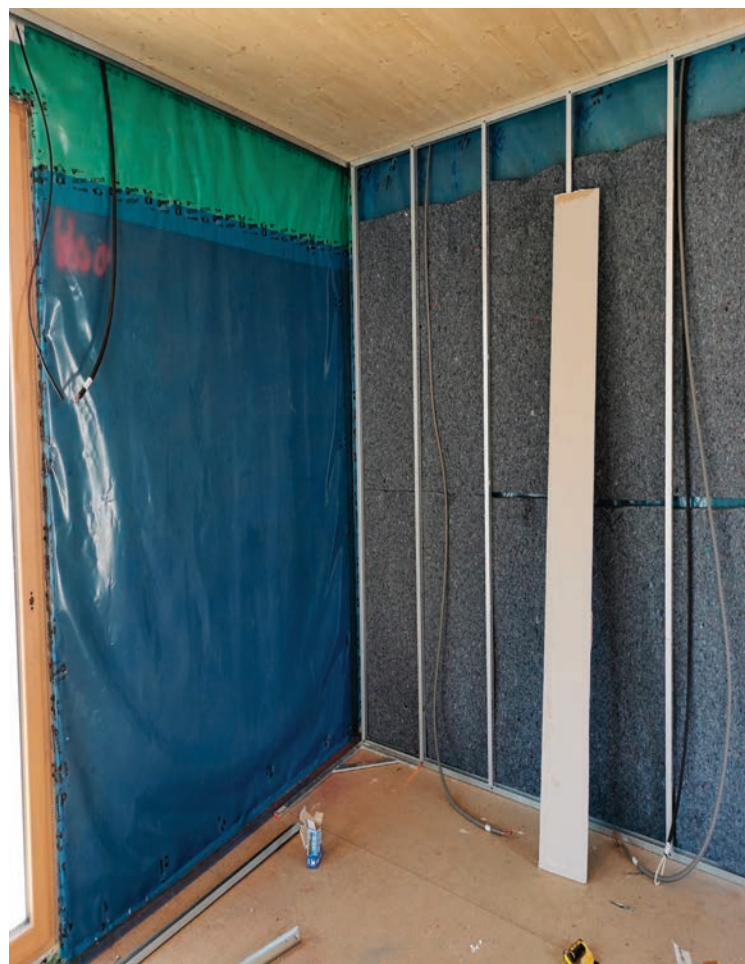
Membrane d'étanchéité et isolation intérieure en coton recyclé.