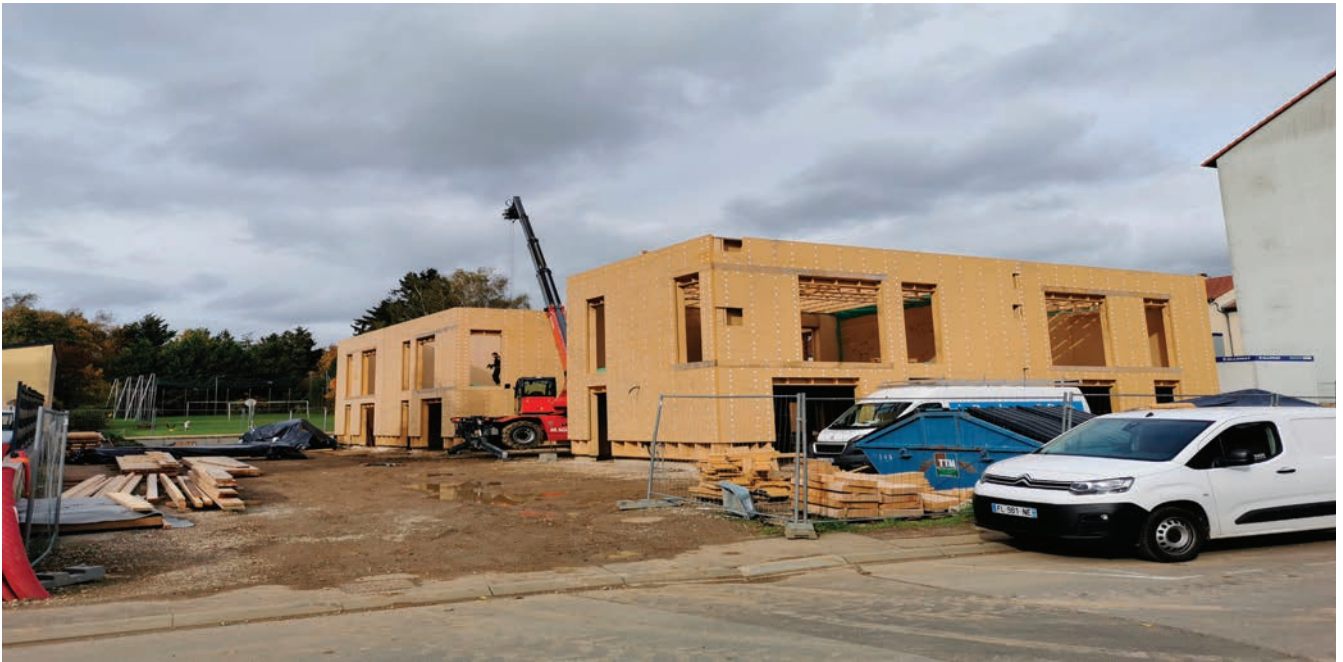
Bâtiment collectif à ossature bois