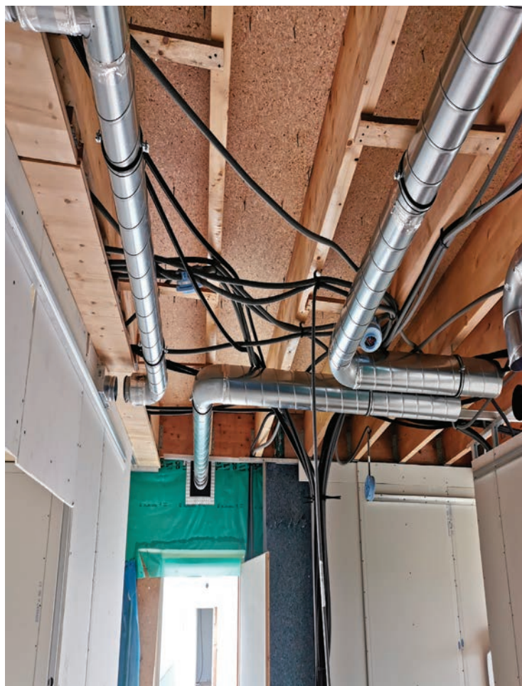
Ventilation double flux