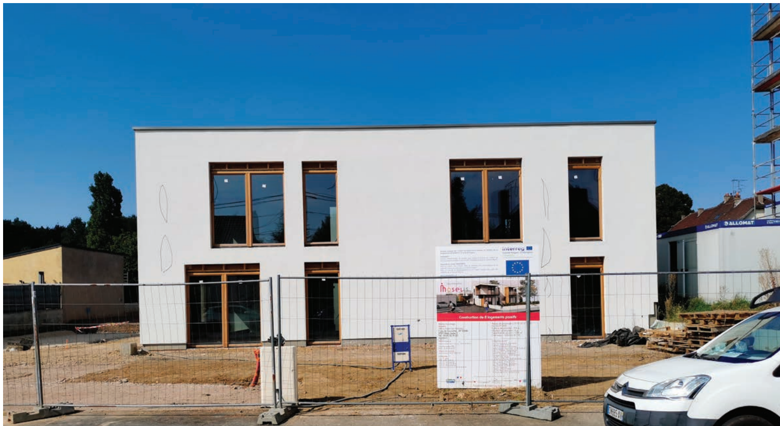
Façade avant avec menuiseries extérieures bois triple vitrage.